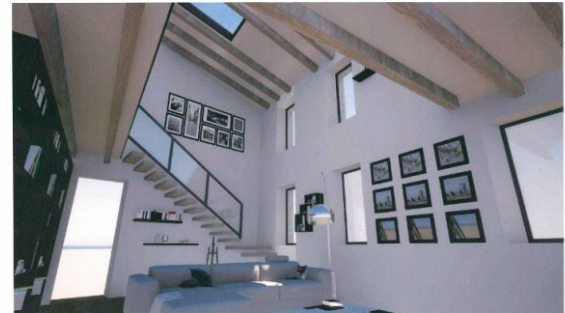
SCORCIO FOTO-REALISTICO RENDERIZZATO DEL SOGGIORNO DEL PIANO PRIMO COL SOPPALCO

DL Architettura Ingegneria Gian Lorenzo & Design Dalle Luche