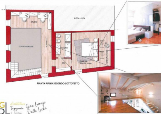
PIANTA PIANO SECONDO-SOTTOTETTO

DL Architettura Ingegneria Gian Lorenzo & Design Dalle Luche