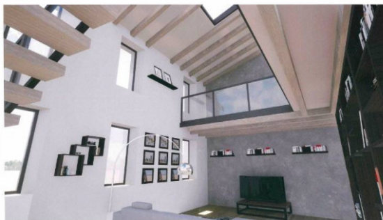
SCORCIO FOTO-REALISTICO RENDERIZZATO DEL SOGGIORNO DEL PIANO PRIMO COL SOPPALCO

DL Architettura Ingegneria Gian Lorenzo & Design Dalle Luche