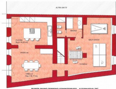
PIANTA PIANO TERRENO-SEMINTERRATO - ALTERNATIVA "B"

DL Architettura Ingegneria Gian Lorenzo & Design Dalle Luche